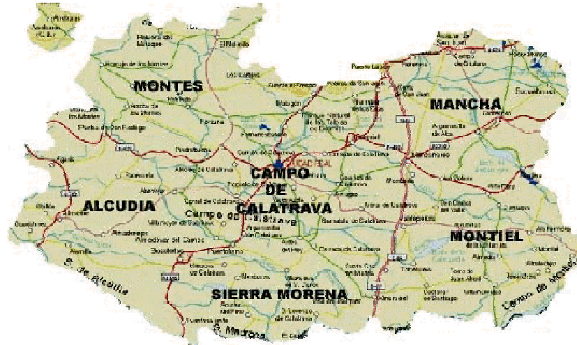
Figura 1: Situación de La Mancha dentro de la provincia de Ciudad Real.