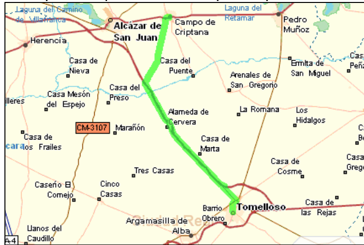
Figura 6: mapa acceso por carretera a Campo de Criptana desde Tomelloso.