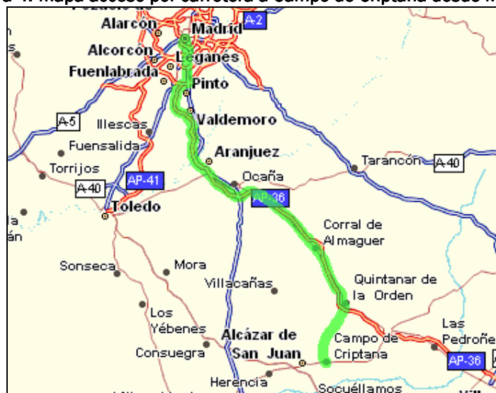
Figura 4: mapa acceso por carretera a Campo de Criptana desde Madrid.

Para acceder a Campo de Criptana desde Madrid: Cogemos la autovía A4/E5 hasta tomar la salida 17. Después seguimos por la M-50 hasta tomar la salida 48 hacia Aranjuez/Ocaña/Córdoba y cogemos la R-4. Después continuamos por la autopista Ocaña-La Roda y seguimos por la AP-36. Enlazamos con la N-301 y luego continuamos por la CM-310 hasta llegar a Campo de Criptana