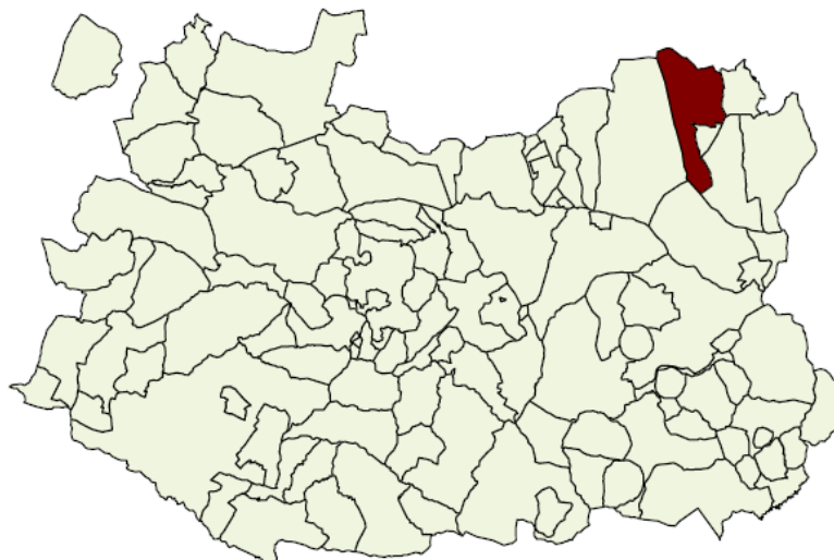
Figura 2: Situación de Campo de Criptana dentro de la provincia de Ciudad Real.