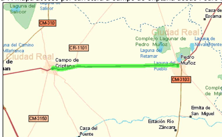
Figura 7: Mapa acceso por carretera a Campo de Criptana desde Pedro Muñoz.