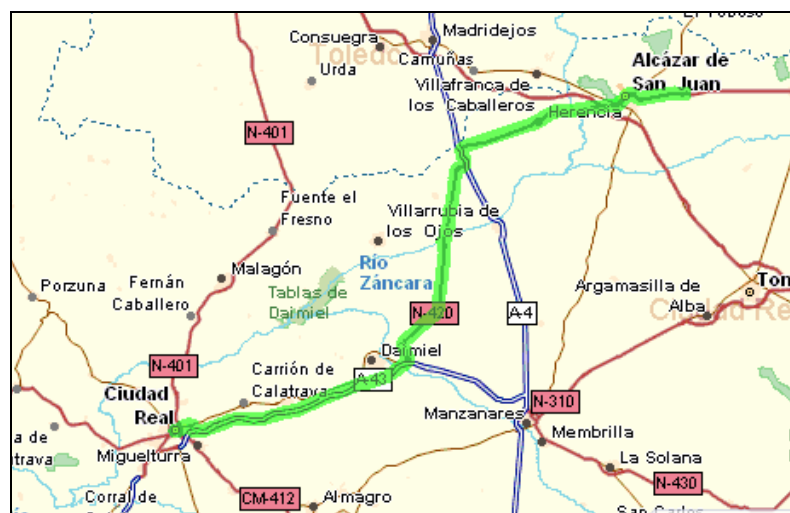
Figura 3: Mapa acceso por carretera a Campo de Criptana desde Ciudad Real.

Si procede de Ciudad Real se debe coger la N-430, luego continuar por la N-420 hasta enlazar con la autovía A-43. Después tomamos la salida 33 hacia Puerto Lápice/Madrid, enlazamos con la N-420 y luego seguimos por la A4/E5 dirección Cuenca. Después retomamos la N-420 que nos lleva a Campo de Criptana.